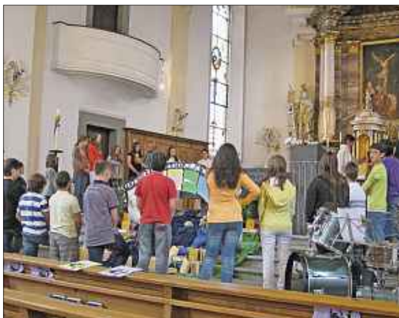
Segensfeier 2009 in der Kirche Emmen.