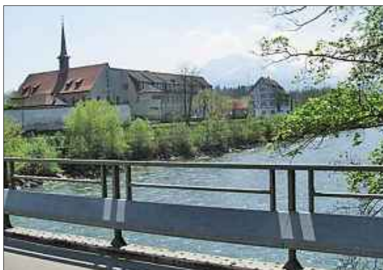
Begegnungstag der Pfarrei St. Maria in Rathausen.

Der diesjährige Begegnungstag der Pfarrei St. Maria findet am Sonntag, 20. Juni, in Rathausen statt.