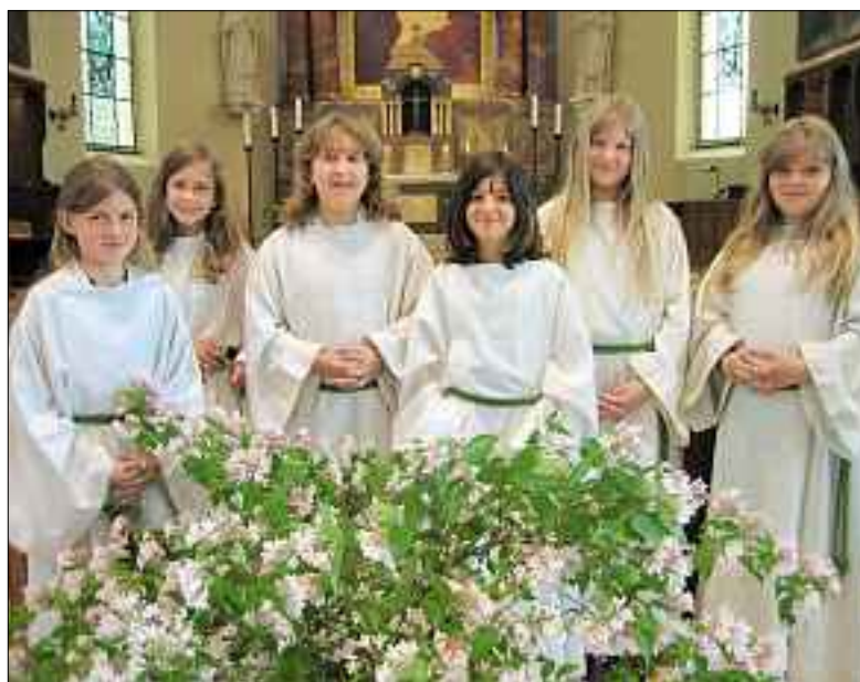
Neuen Ministrantinnen.

Am Samstagabend, 19. Juni, werden sieben neue Ministrantinnen während dem Gottesdienst in die Gerliswiler Schar aufgenommen.