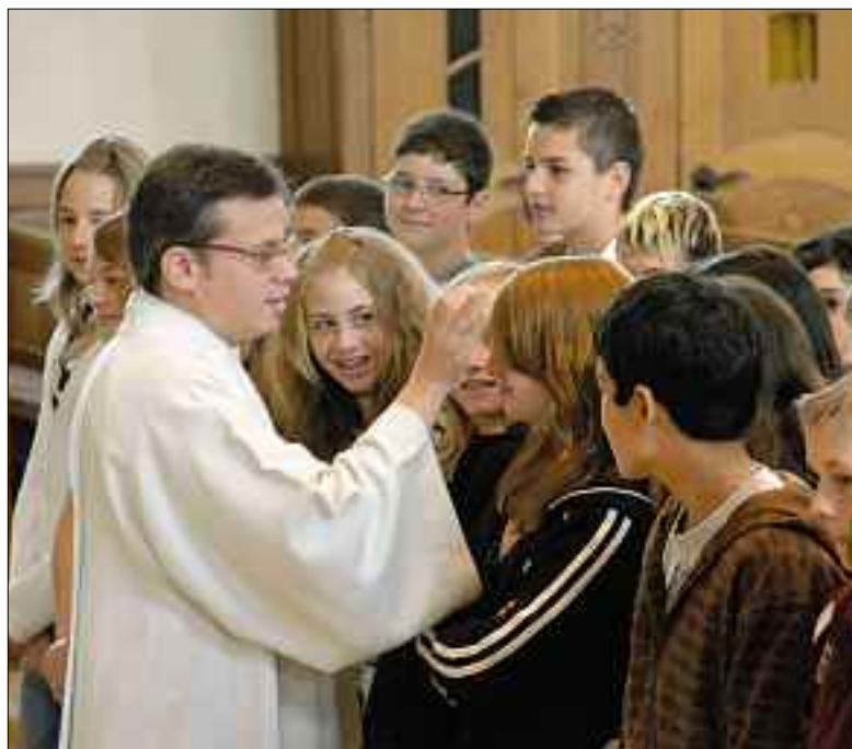
Segensfeier 2009 in Gerliswil.

SA, 26. Juni, 17.30: Rudolf Karrer-Elmiger