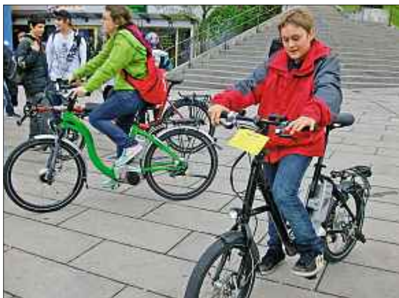
Testfahrt bei Velociped.