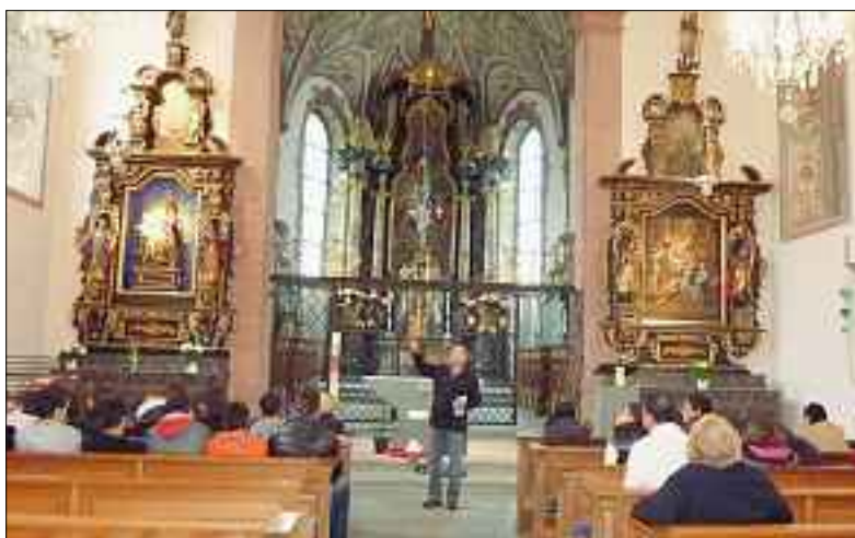
Links: Führung in der Kirche Werthenstein.