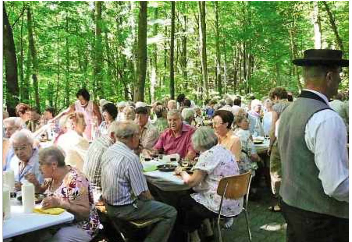
Friedliche Festgemeinschaft im Schooswald.