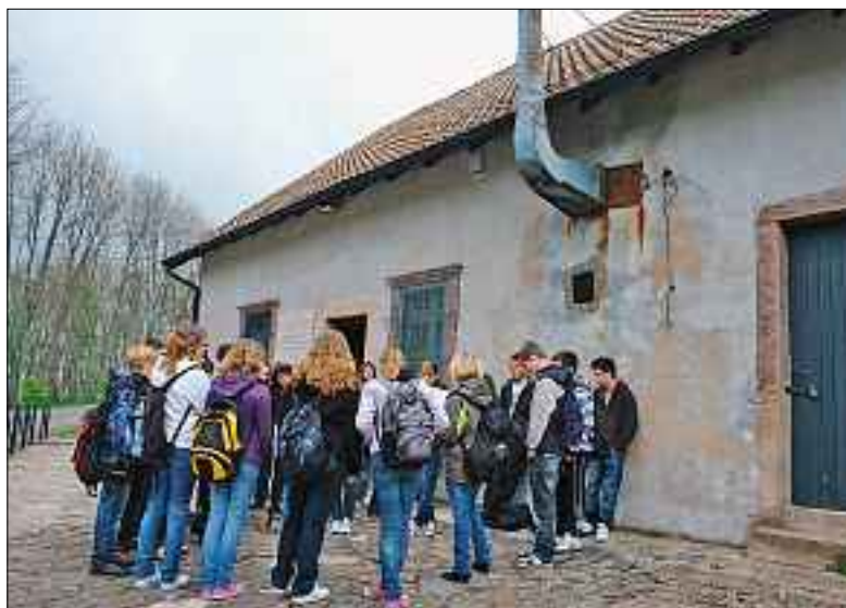
Schüler vor der Gaskammer im KZ Struthof Natzweiler, Elsass.