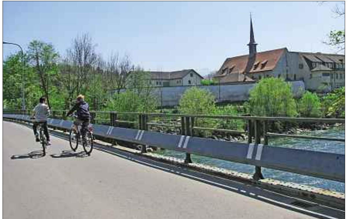
Brücke nach Rathausen.

Warum es Kirchen und Hilfswerke braucht. Seite 7