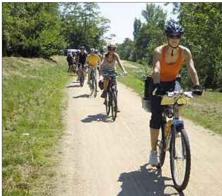
Wer kommt im Sommer mit ins Velolager in den Europa-Park nach Rust?