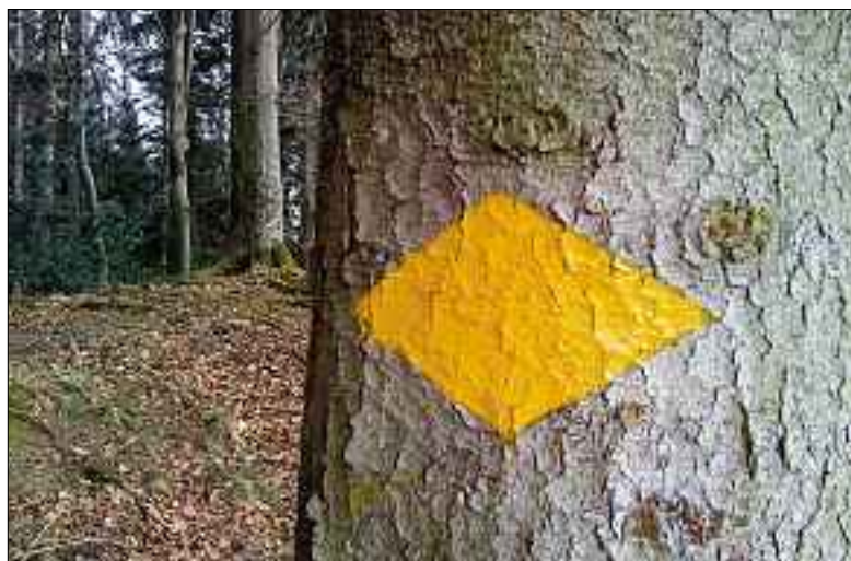
In welche Richtung führt der Weg?

Pfingsten ist eine heisse Sache, weil damit der erste Auftritt der Christenmenschen in der Geschichte erfolgte. Ist ein Austritt der letzte Auftritt in dieser Geschichte?