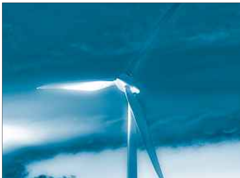
Der Geist weht wo er will.

«Komm Schöpfer Geist» – zu Pfingsten wird dieser Hymnus wieder in vielen Kirchen gesungen. Hier einige Gedanken, die beim Betrachten einzelner Textzeilen entstehen können.