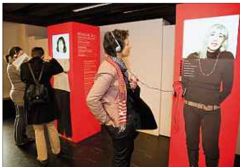
Die Ausstellung «Im Fall» zeigt an konkreten Beispielen auf, was es bedeutet, von der Sozialhilfe zu leben.

Zum Beispiel: Die Sozialberatungen der Katholischen und Reformierten Kirche Luzern beraten und unterstützen Familien, die eine Tieflohnarbeit haben, oder Alleinstehende, die temporär arbeiten und denen eine Zahnarzt- oder Brillenrechnung oder eine andere Unwägbarkeit das knappe Budget aus den Angeln hebt.