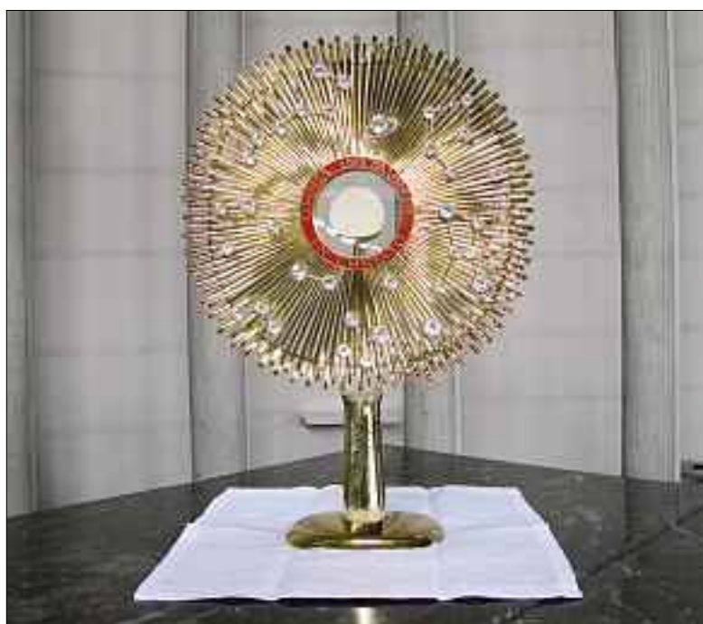
Zur Verehrung und Anbetung – Monstranz der Kirche St. Maria.

Kern der christlichen Botschaft ist die Verkündigung einer Gemeinschaft, eines Lebens mit Gott, das zur Solidarität unter den Menschen führt. In dieser Gemeinschaft sind alle Söhne und Töchter ein und desselben Vaters.