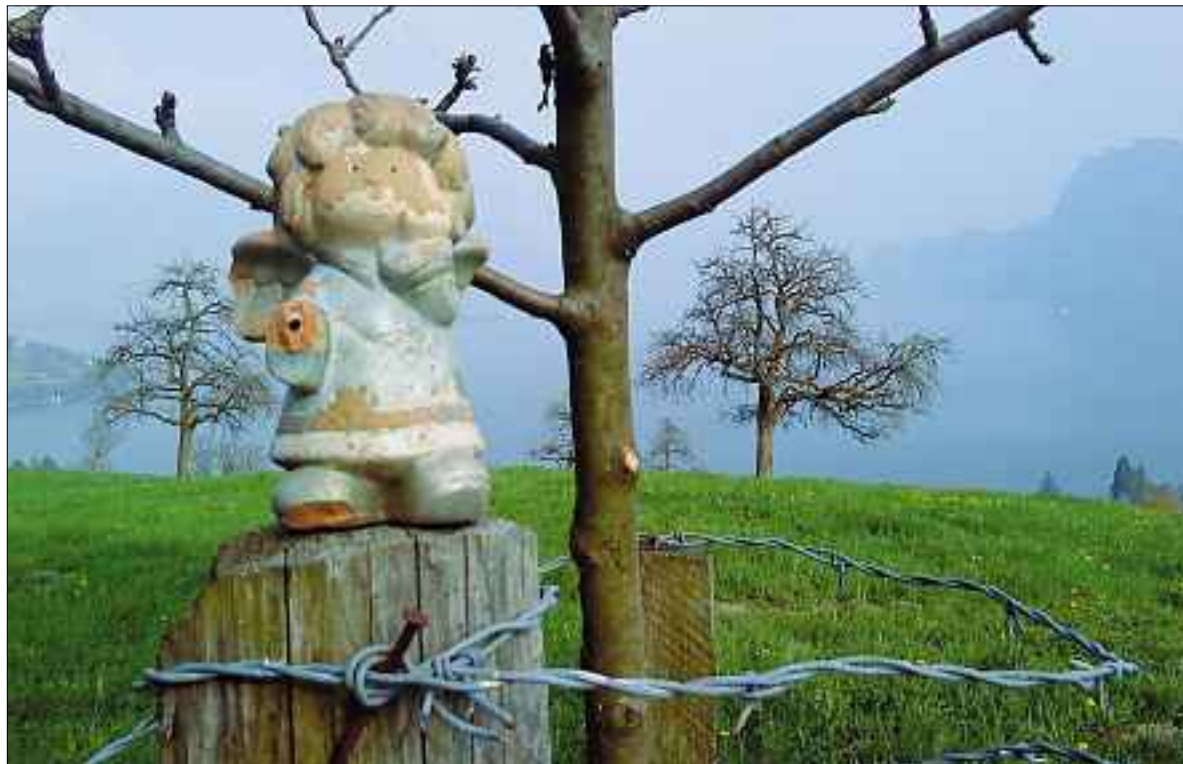
Lädierter Engel.