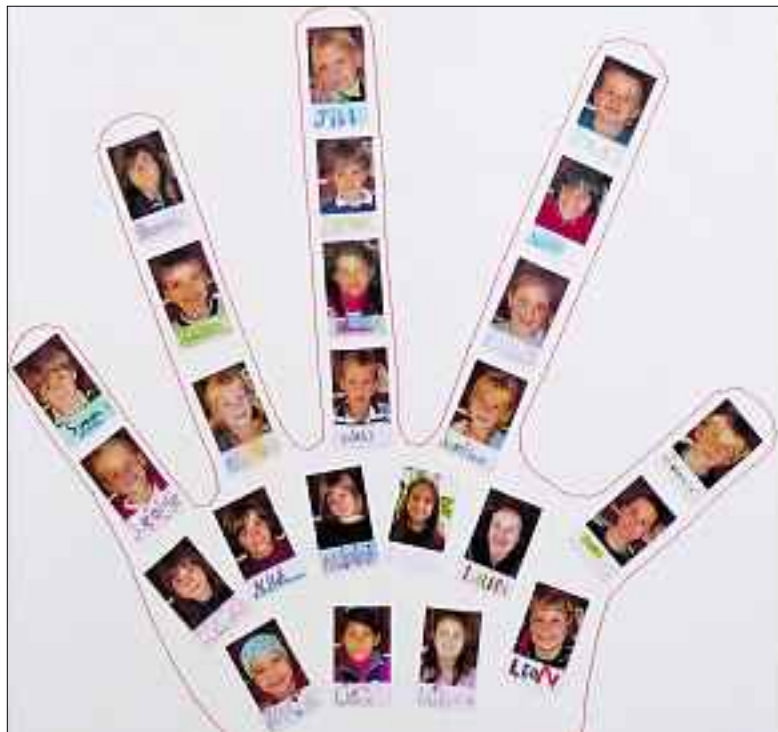
Erstkommunionkinder der Pfarrei St. Maria.