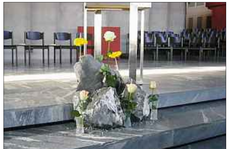
Besondere Gestaltung des Altarraumes.

Bei der Kirche als Gemeinschaft der Menschen mit Gott wäre es vermessen, wenn ein Sakristan von Veränderungen schreiben würde. Aber sicher ein Wunsch und zugleich eine Hoffnung von mir ist es, dass zukünftig der Papst die Zeichen der heutigen Welt besser zu interpretieren weiss. Bei der Kirche als Raum, möchte ich meine Veränderungen nicht einfach so offen legen, denke aber, Leute, die uns regelmässig besuchen, werden allfällige Umgestaltungen sicher bemerken.