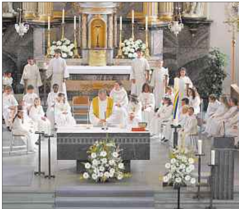
Erstkommunion 2009 in Emmen.