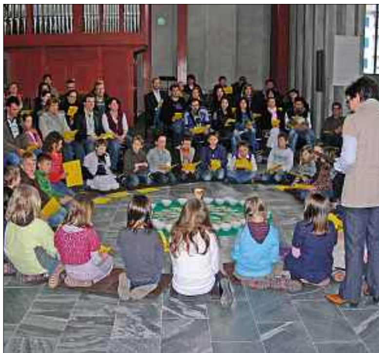
Erstkommunionkinder am Eltern-Kind-Tag.

Am Weissen Sonntag, 11. April, um 10.15 feiern 28 Kinder in der Pfarrei Bruder Klaus die Erstkommunion.