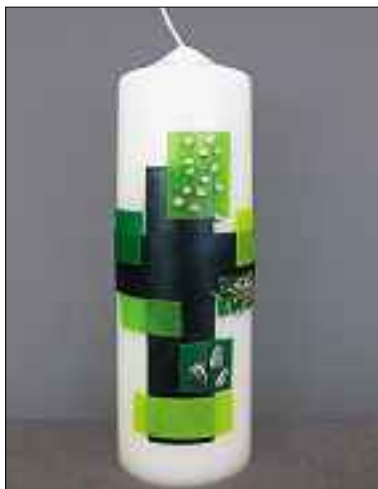
Osterkerze 2010.

mva. Mit viel Engagement und Liebe fürs Detail suchten die Leiterinnen vom Blauring Emmen das Motiv für die Osterkerze aus und verzierten auch die Heimosterkerzen. Kräftiges Grün, die Farbe der Hoffnung, prägt dieses Jahr die Osterkerze. Samen bergen neues Leben in sich, Sinnbild für das Leben nach dem Tod, für die Auferstehung. Verwendete Samen: Sonnenblume (Licht/Freude), Buchweizen (Nahrung) und Gras (Vergänglichkeit).