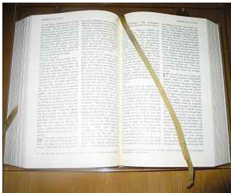
Angesprochen werden durch das Wort Gottes.

Das Wort Gottes hat nichts von seiner Aktualität und schöpferischen Kraft verloren. Es fordert das konkrete Leben und Zusammenleben der Menschen heraus. So wird, wer sich von ihm betreffen lassen will, für seinen Alltag an Glauben, Hoffnung und Liebe gestärkt. Diese seine Wirkung im Innern des Menschen und für ein Leben nach dem Beispiel Jesu gehört ganz zentral zum «Bibelteilen».