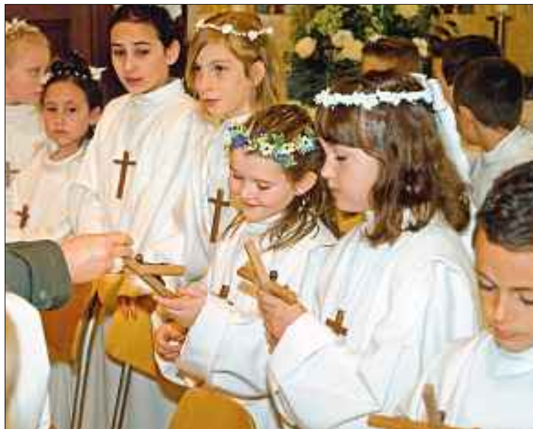
Das geschenkte Kreuz zur Erstkommunion macht Freude.

cm. Am Sonntag, 11. April, werden 37 Erstkommunionkinder die Heilige Kommunion empfangen. Der Festgottesdienst beginnt um 10.30. Vorher werden die Kinder von der Musikgesellschaft beim feierlichen Einzug in die Kirche begleitet.