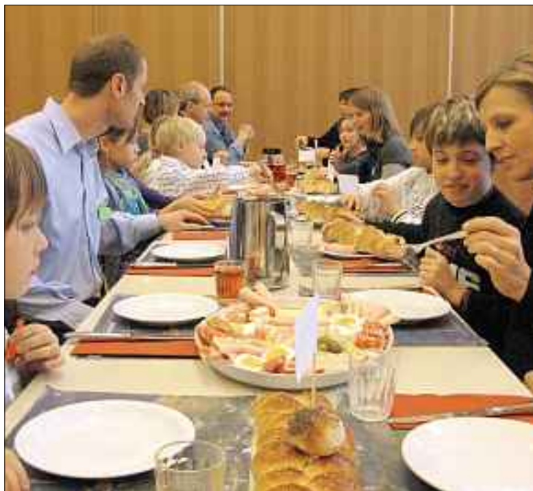
Gemeinsames Nachtessen am Eltern-Kind-Nachmittag.

«Geborgen in Gottes Hand», dieses Leitwort begleitete die Kinder in der Vorbereitungszeit. Es macht deutlich: Als Sohn und Tochter von Gott bin ich angenommen, so wie ich bin. Er bleibt mit mir auf meinem Lebensweg verbunden. Ich darf ihm vertrauen. Im heiligen Brot gibt sich Jesus in die Hand des Menschen. Beim letzten Abendmahl hat Jesus den Seinen die Nähe und Verbundenheit Gottes versprochen. Er schenkt sich, geht mit und ist auf geheimnisvolle Weise da – immer wieder neu. Dass Gott da ist, ist auf verschiedene Art spürbar, gerade auch im Zusammensein