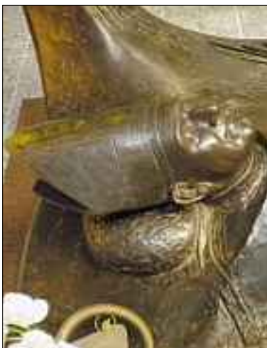
Am Grab von Erzbischof Oscar Romero.

Weitere Informationen im Internet unter: www.romerohaus.ch/romerotage