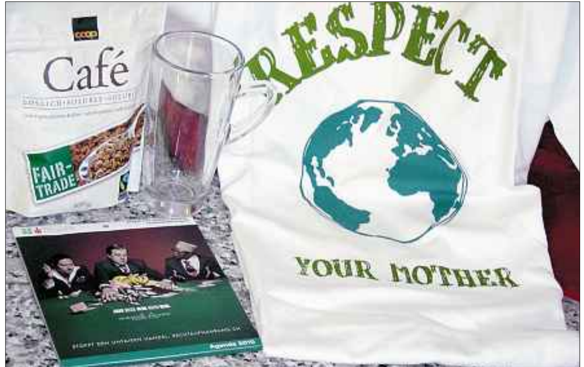
Fair-Trade-Produkte sind im Trend.