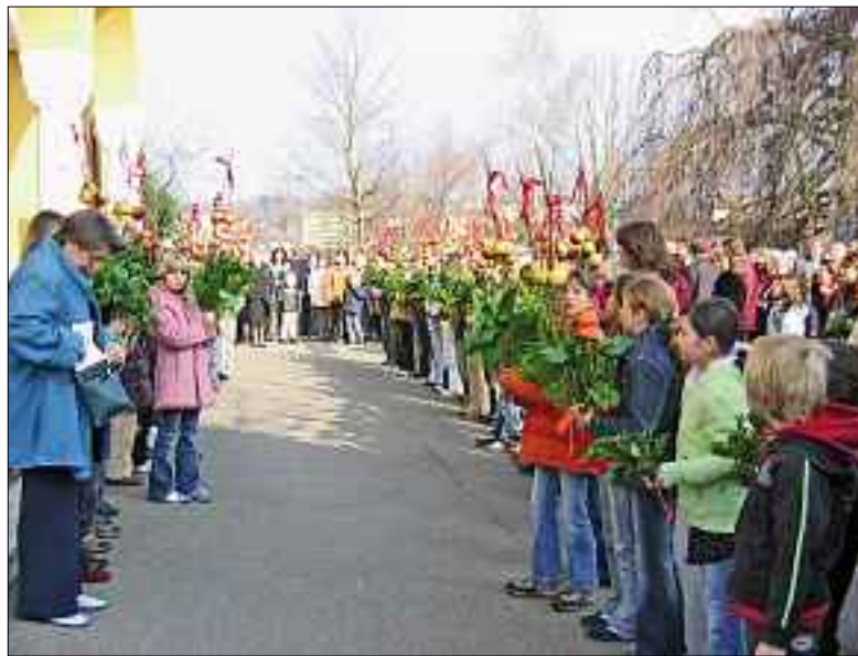
Vor dem Einzug in die Pfarrkirche.

cm. Die Vorbereitungen auf die Karwoche und Ostern sind vielfältig. Das Binden von Palmen ist eine Möglichkeit, sich auf die heilige Woche einzustimmen.