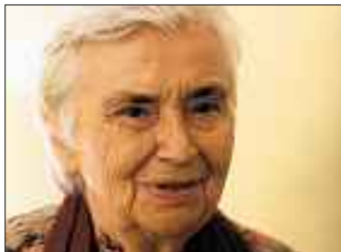
Ruth Pfau: seit 50 Jahren in Pakistan.

Am 8. März 1960 begann die junge deutsche Ärztin und Nonne Dr. Ruth Pfau in einer elenden Bretterbude in Karachi ihre Arbeit für die Leprakranken. Heute steht in Karachi das MALC-Hospital, die Lepra ist im Griff dank der über das ganze Land errichteten Gesundheitsstationen, Dorfgemeinschaften werden zu Selbsthilfefzentren entwickelt. Sunniten, Shiiten und Christen arbeiten im Einvernehmen zusammen. Der tägliche Kampf jedoch mit den Problemen und all der Not in dem schwierigen Land und auch um die Geldmittel, bleibt. «Im Zentrum unserer Arbeit steht der Mensch», ist die Devise. «Und hätte die Liebe nicht» heisst das neueste Buch von Ruth Pfau (Herder), die tiefgreifende Lebensbilanz der unermüdlichen 80-Jährigen.