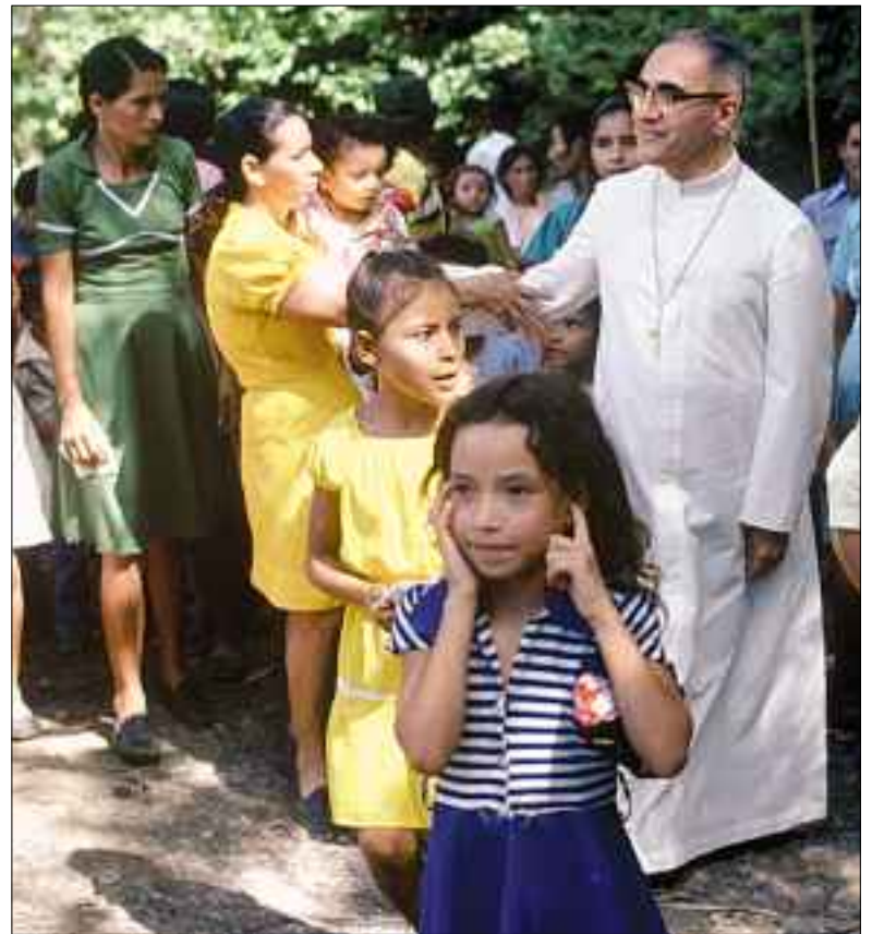
Aus dem konservativen Kleriker wurde ein Pastor der Armen.

Diese Umkehr der Kirche lebte Romero während seiner drei Jahre als Erzbischof in San Salvador. Aus einem konservativen Kleriker wurde ein Pastor der Armen. Er besuchte Slums und hörte sich die Nöte der Campesinos in seinem Bischofssitz an. In seinen Predigten behandelte er Sonntag für Sonntag Geschehnisse in seinem Lande, die ihm die Leute berichtet hatten, und deutete sie im Lichte des Evangeliums. Er liess seine Predigten im Radio in ganz Zentralamerika verbreiten, und als sein Sender von Gegnern gesprengt wurde, packte er eigenhändig mit an, damit schnellstens ein neuer Sender installiert werden konnte. Es war ihm wichtig, dass seine Worte etwas bewirkten und die christliche Botschaft zu einer gesellschaftsverändernden Kraft würde. Nach Romeros Tod kam es zum Bürgerkrieg. Die Arena-Partei, deren verstorbener Gründer, Mayor Roberto D'Aubuisson, einer der verantwortlichen Mörder Romeros war, übernahm in El Salvador die Herrschaft. Erst seit 2009 gibt es eine neue Regierung unter Mauricio Funes, die sich explizit auf das