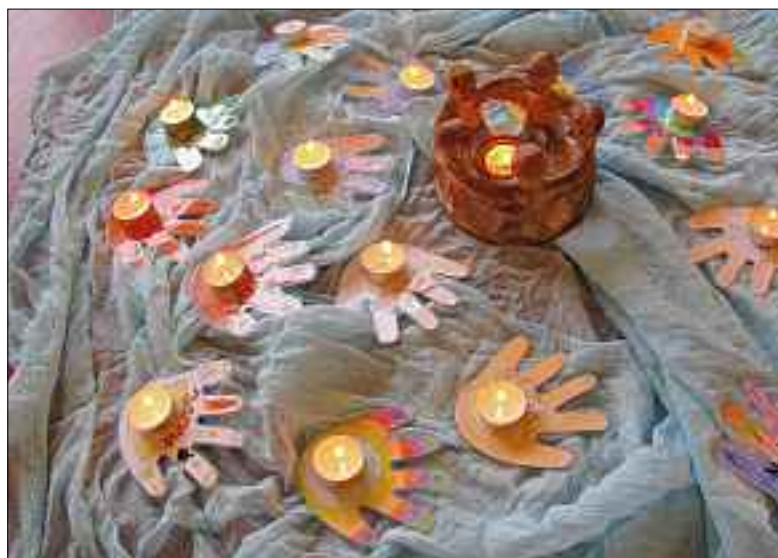
Anfangsritual mit Licht und Händen der Erstkommunionkinder.

Am Samstag, 23. Januar findet im Pfarreiheim St. Maria der Begegnungsnachmittag der Erstkommunionfamilien statt.