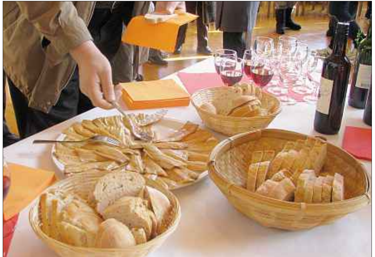
Ökumenische Agapefeier 2008 in der reformierten Kirche Gerliswil mit Brot, Fisch und Wein.

Bis zum 1. März dürfen Wahlvorschläge für die Behördenmitglieder der Kirchgemeinde Emmen eingereicht werden. Seite 8