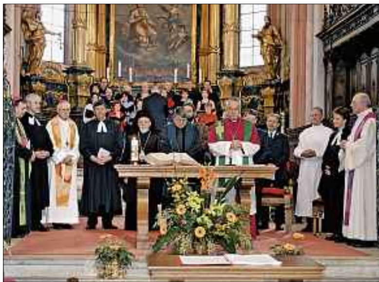
Mitgliedkirchen der Arbeitsgemeinschaft christlicher Kirchen in der Schweiz haben 2005 in St. Ursanne die Charta Oecumenica unterzeichnet.