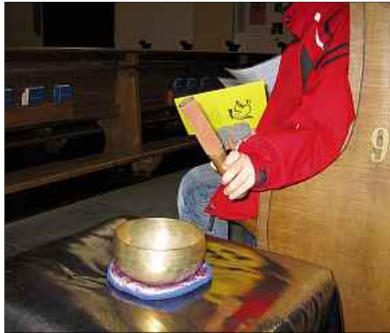
Kinder der 4. Klasse in der Kirche auf dem Versöhnungsweg.

Es war einmal ein alter Beichtstuhl. Vor ihm kniete kein Sünder mehr. Einst waren sie noch gewohnt, periodisch reinen Tisch zu machen. Unterdessen pflegt die heutige Gesellschaft bis in die TV-Serien ein öffentliches Beichten auf viel bequemerem Stühlen.