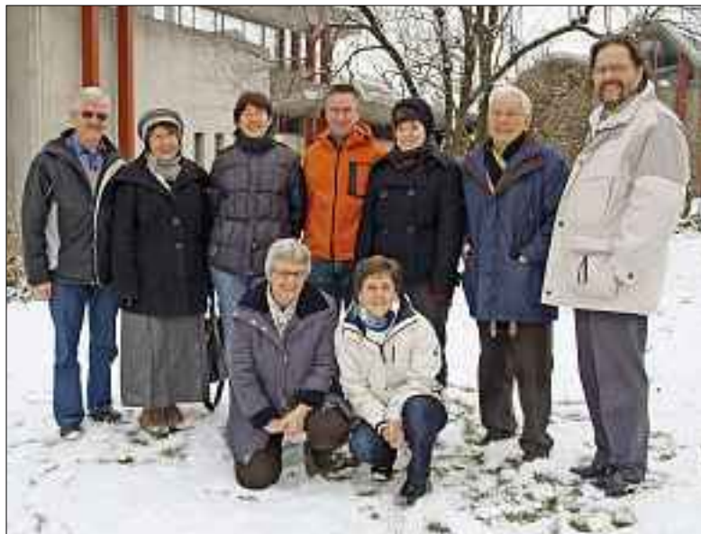
Das Team Bruder Klaus.

Das neue Jahr hat schon wieder begonnen. Ein Grund, einmal zusammenzustehen. Zusammenstehen will das Team vor allem, um den vielfältigen Dienst in der Pfarrei zu leisten, und dies mit viel Freude.