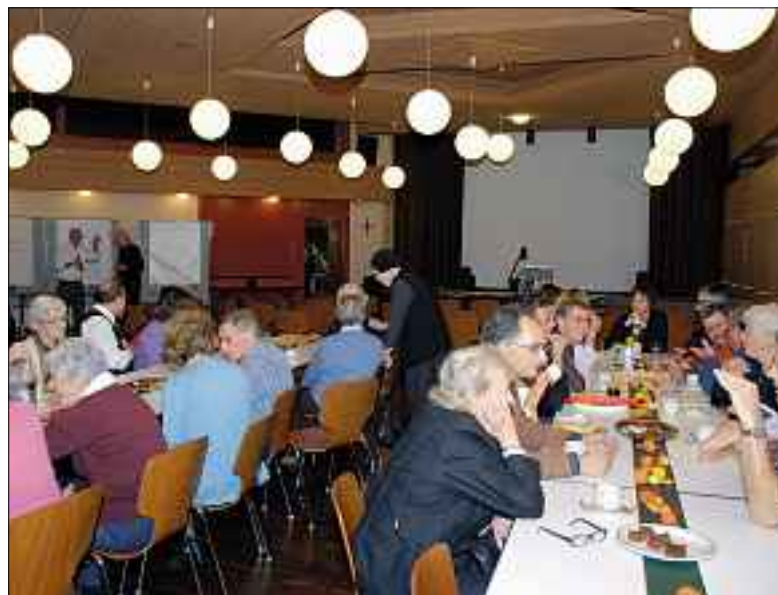
Pfarreiversammlung 2009.

Am 5. November lud die Pfarrei zur Pfarreiversammlung ins Pfarreiheim ein. Die Besucherzahl verdoppelte sich im Vergleich zum Vorjahr. Es war ein interessanter Abend mit vielen Informationen und regem Austausch.