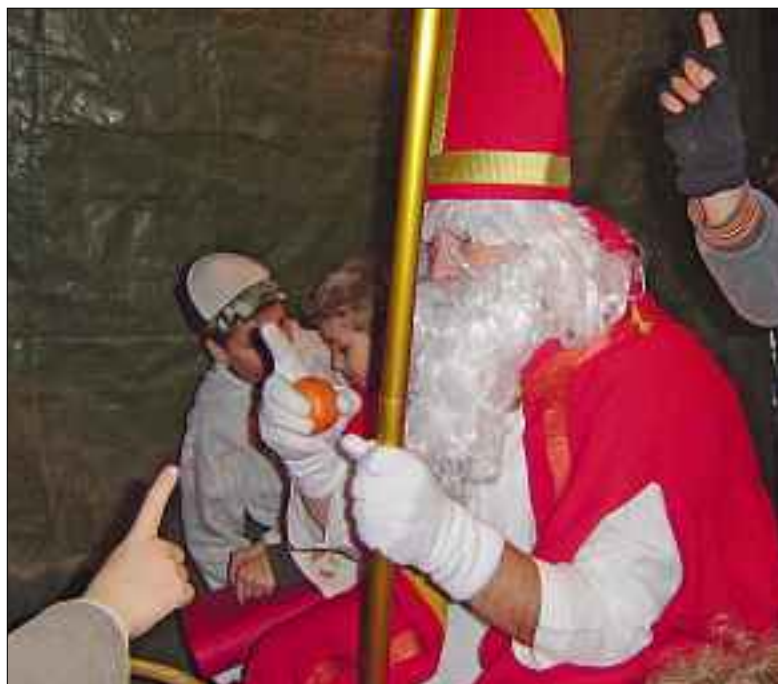
Der St. Nikolaus zu Besuch.